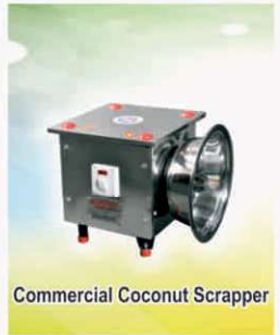
Commercial Coconut Scrapper