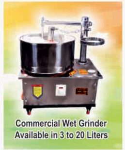
Commercial Wet Grinder Available in 3 to 20 Liters