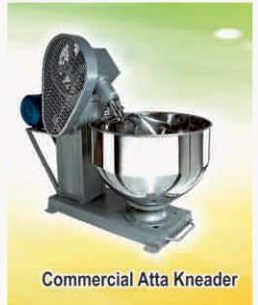
Commercial Atta Kneader