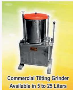
Commercial Tilting Grinder Available in 5 to 25 Liters