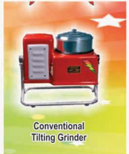
Conventional Tilting Grinder