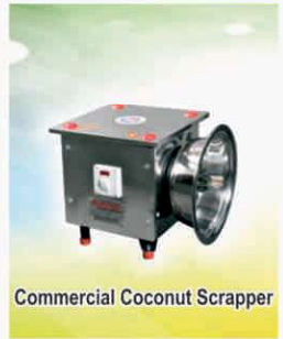
Commercial Coconut Scrapper