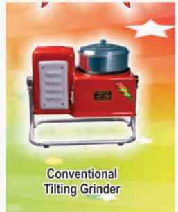
Conventional Tilting Grinder