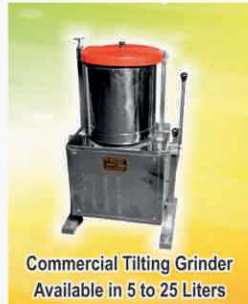
Commercial Tilting Grinder Available in 5 to 25 Liters