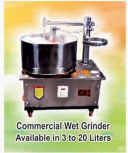
Commercial Wet Grinder Available in 3 to 20 Liters