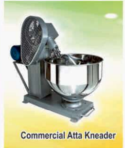
Commercial Atta Kneader