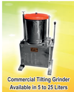
Commercial Tilting Grinder Available in 5 to 25 Liters