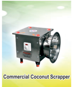
Commercial Coconut Scrapper