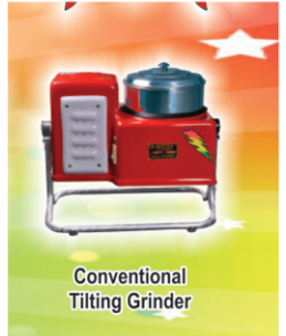
Conventional Tilting Grinder