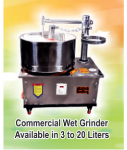
Commercial Wet Grinder Available in 3 to 20 Liters