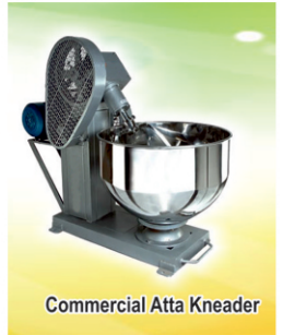
Commercial Atta Kneader