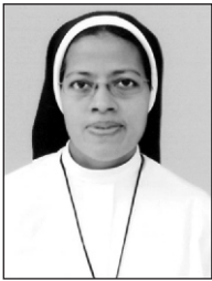
Sr. ഗ്രേസിലിൻ FCC